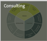
Projekt / Change